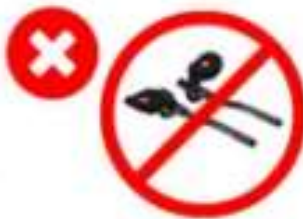
Clip on aerobars