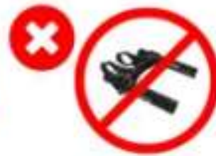
Short clip on aerobars