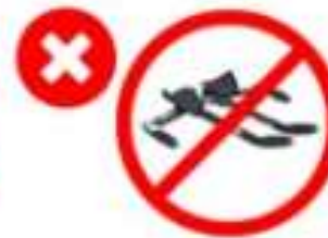
Handlebars with built in aerobars